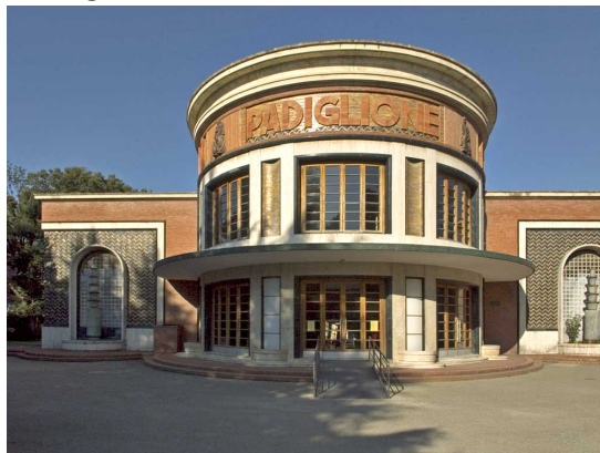
Padiglione delle Feste