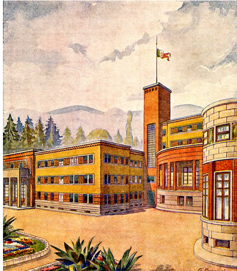
Veduta dello stabilimento e del Grand Hotel in un manifesto pubblicitario di G. Cavazzini