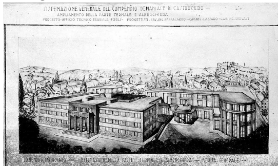
Veduta dello stabilimento e del Grand Hotel in uno dei progetti di ampliamento