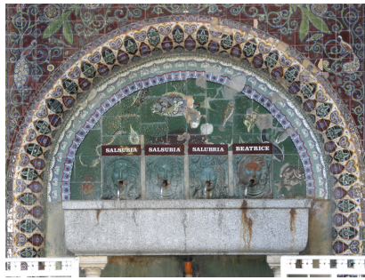
Particolare del Tempietto delle Acque