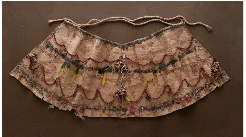
FTAY Didascalia dopo il restauro