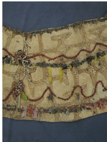
FTAY Didascalia dopo il restauro